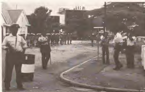
Luna di augustus 1977, tabata un luna preto den historia di Aruba. E riot comando polis a wordo manda Aruba pa a atrapa nos pueblo, door di e gobierno Antiyano. Esaki a sosede cu cooperacion di e partido minoritario di Aruba, P.P.A., cual tabata y ta sosteniendo e gobierno Antiyano.

ministro Hulandes pa asuntunan Antiyano Aruba pa sigui delibera riba e asunto pa independencia di Aruba.